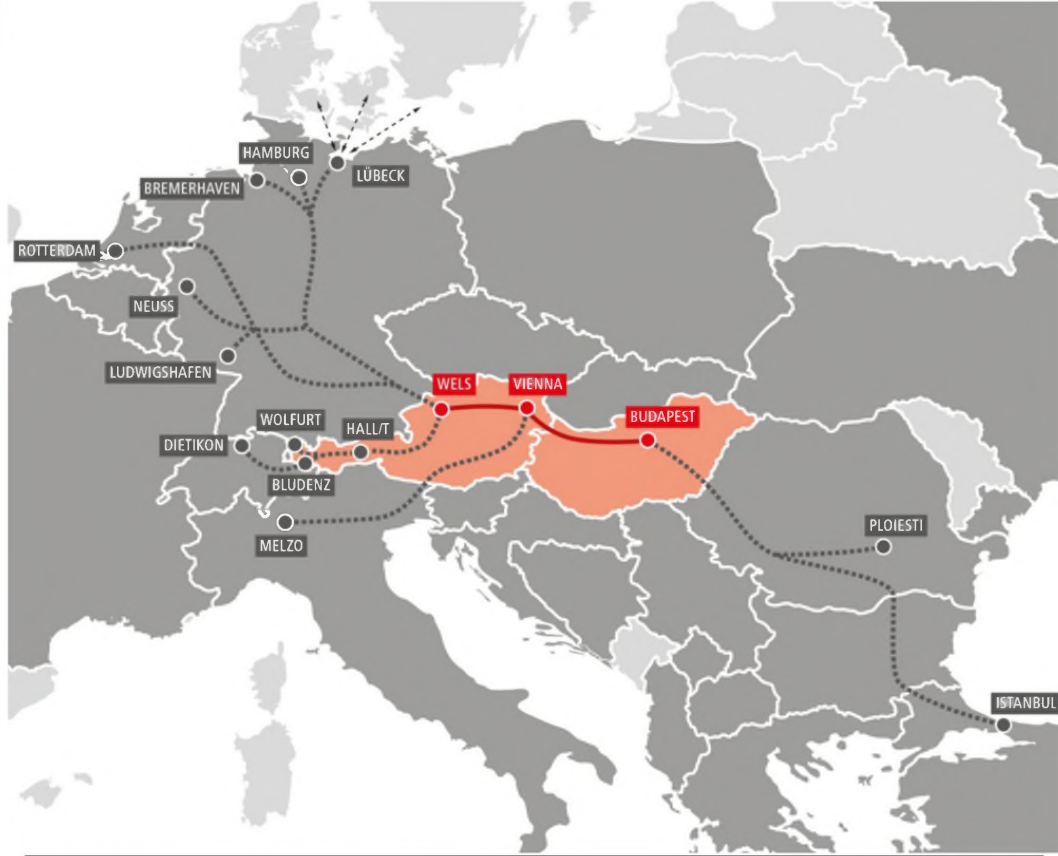
AVRUPA BLOK TREN TAŞIMALARIMIZ

'Haftalık gidiş dönüş olarak 2 blok tren çıkışı gerçekleştiriyoruz'