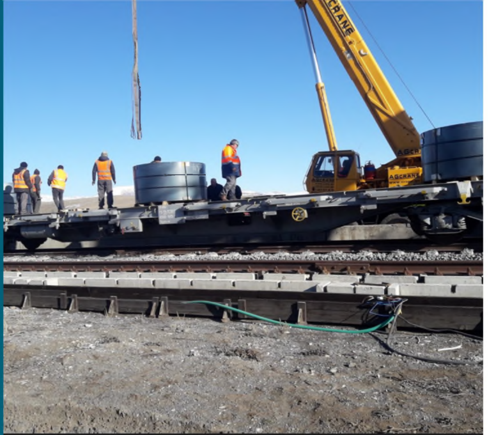
RUSYA MENŞEİLİ RULO SAÇ TAŞIMALARI

Rusya çelik sanayi devi rulo sac taşımaları ile BTK hattına dahil olmuştur ve deniz yolu taşımalarının büyük bir kısmını demiryolu ile yapmaya başlamıştır.