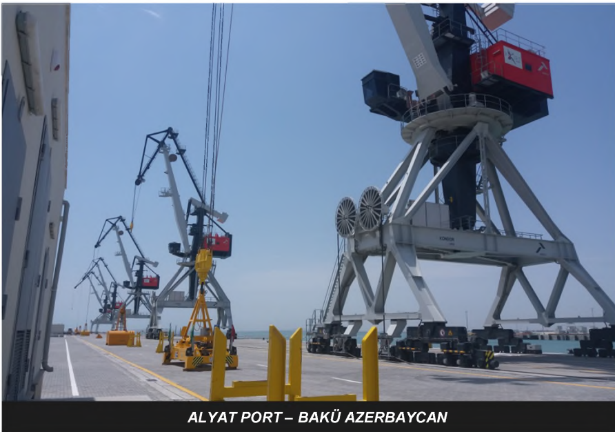
ALYAT PORT – BAKÜ AZERBAJYCAN